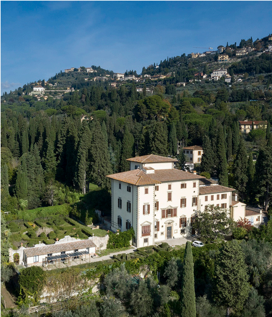
Villa La Torraccia, sede della Scuola di Musica di Fiesole Fondazione Onlus